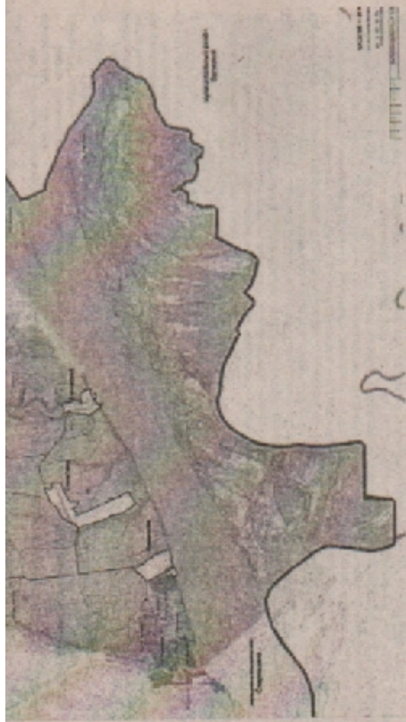
КАРТА ФУНКЦИОНАЛЬНЫХ ЗОН СЕЛЬСКОГО ПОСЕЛЕНИЯ ОСИНОВКА МУНИЦИПАЛЬНОГО РАЙОНА СТАВРОПОЛЬСКИЙ САМАРСКОЙ ОБЛАСТИ